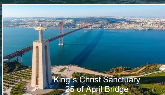
King's Christ Sanctuary 25 of April Bridge

*Програмата е предварителна и подлежи на промени.