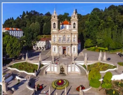
Bom Jesus from Braga