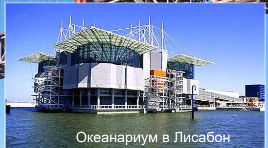
Океанариум в Лисабон