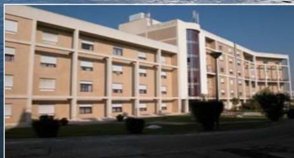
Военно-почивен комплекс Оейраш