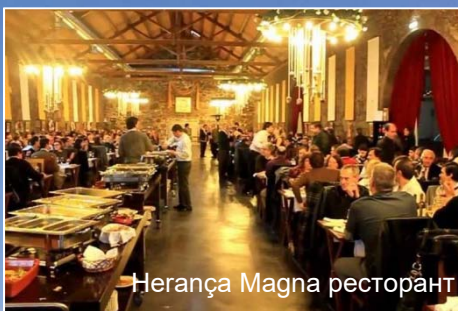
Herança Magna ресторант